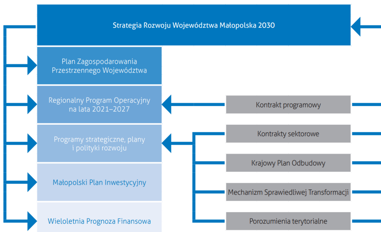
Rys. 1 Schemat wdrażania polityki rozwoju w Województwie Małopolskim